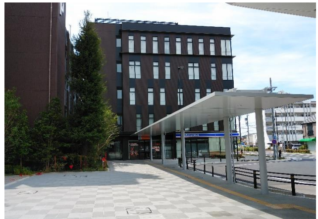
駅前広場から望む住宅棟及び商業・業務棟のエンタランス