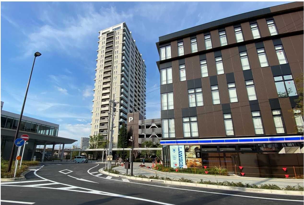
竣工写真（南西より区域全体）

当事業グループ3社は、2017年2月より特定業務代行者として事業参画し、事業協力を行って参りました。