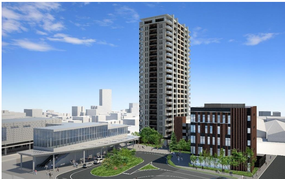
≪ 全体イメージ ≫ ※イメージパース等は今後の協議等により変更となる可能性があります

これまで当地区は、2014年にまちづくり協議会を設立、2017年8月に都市計画決定告示を経て、再開発組合設立に向けて事業を進めて参りました。今後、権利変換計画認可を経て2021年の竣工を目指し、事業を進めて参ります。