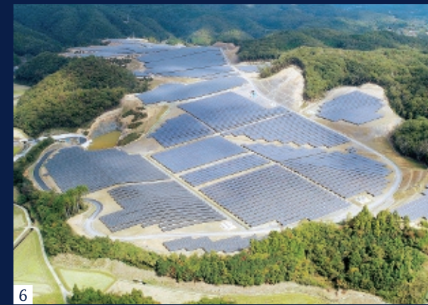
■ 東海北陸自動車道 池之島工事 (岐阜県高山市) ■ 新東名高速道路 新磐田スマートインターチェンジ工事 (静岡県磐田市) ■ 小古首宅地造成 (三重県四日市市) ■ 名古屋鉄道 犬山線 布袋駅本線軌道 (愛知県江南市) ■ 北陸新幹線、福井橋りょう他 (福井県福井市) ■ FBIT美咲発電所 (岡山県久米郡美咲町)