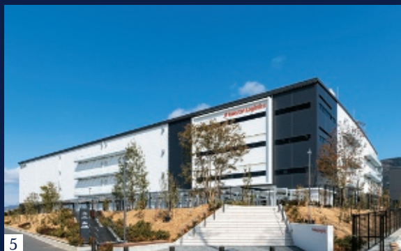
■ IKEA長久手 (愛知県長久手市) ■ ザ・パークハウス名古屋 (愛知県名古屋市) ■ ホテルインディゴ犬山有楽苑 (愛知県犬山市) ■ DPL名港弥富I (愛知県弥富市) ■ GLP八尾I (大阪府八尾市)